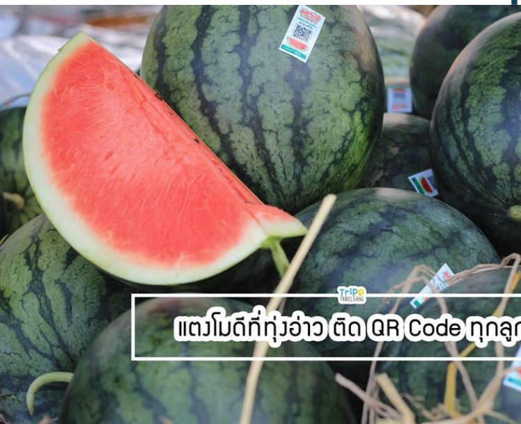
แตงโมดีที่ทุ่งอ่าว ตัด QR Code ทุกลูก