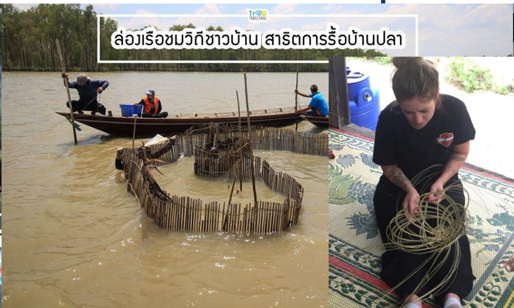
ล่องเรือชมวิถีชาวบ้าน สาริตการรื้อบ้านปลา