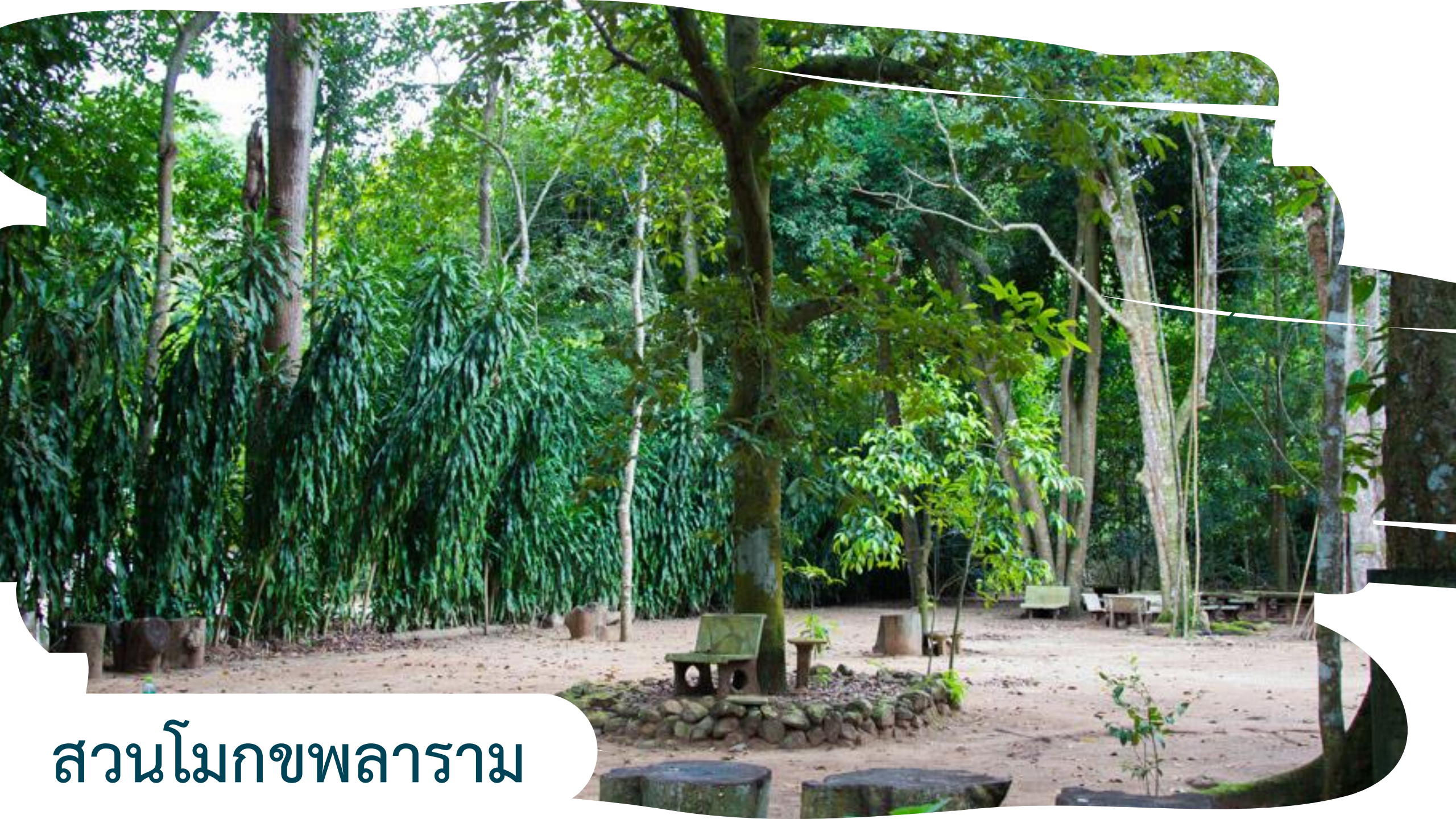
สวนโมกขพลาราม