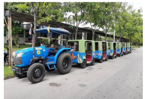
รถมาลัย 36 ที่นั่ง