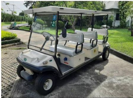
รถไฟฟ้า 6 ที่นั่ง