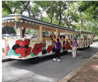
รถราง 36 ที่นั่ง